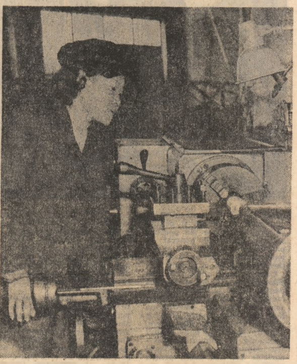
R.P.D. COREEANA: Imagine dintr-o secție a Uzinei mecanice din Songdo, întreprindere specializată în fabricarea de echipament necesar industriei extractive coreene