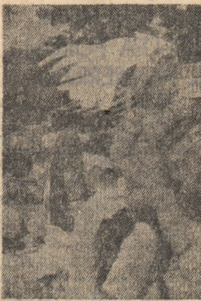
FRANȚA: Aspect de la o amplă demonstrație pentru pace desfășurată la Paris