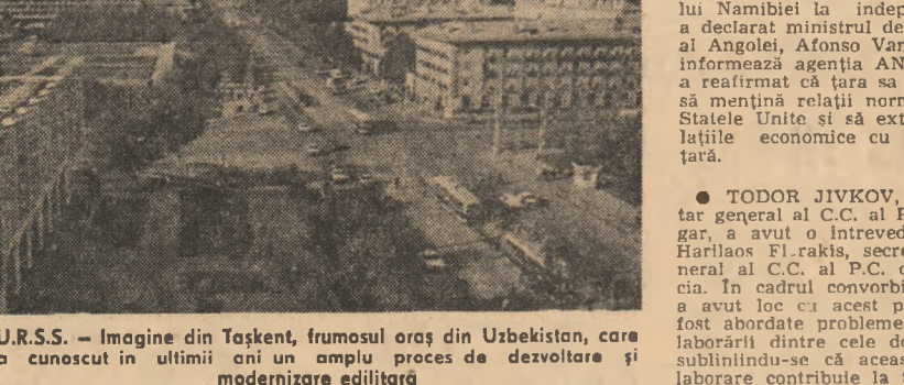
U.R.S.S. — Imagine din Tașkent, frumosul oraș din Uzbekistan, care a cunoscut în ultimii ani un amplu proces de dezvoltare și modernizare editată