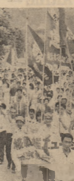
Imagine din timpul demonstrației de protest din orașul Yokosuka, în timpul căreia numeroși cetățeni au cerut interzicerea accesului în porturile japoneze a vasului militar american New Jersey