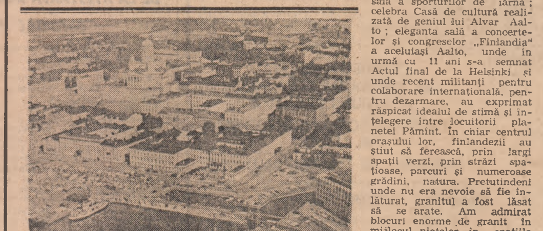
Insemnări din Finlanda

Oraș curat și limpede, cu clădiri albe, Helsinki îți dă senzația că aparține altui pământ, cit și mării. Limitele orașului și direcțiile sale de dezvoltare au fost determinate de mare. Neavând posibilitatea să se întindă spre sud, el a avansat viguros spre nord, conturându-și forma actuală, amintind oarecum de un con răsturnat. În timpul vizitării orașului m-au impresionat piețele dispuse în careu spațioase, străzile largi și în mod deosebit, centrul neoclasic. Stabilitatea unui centru al capitalei Finlandeze, bine trasat, care s-a frunzeat viitorul peste veacuri, constituie