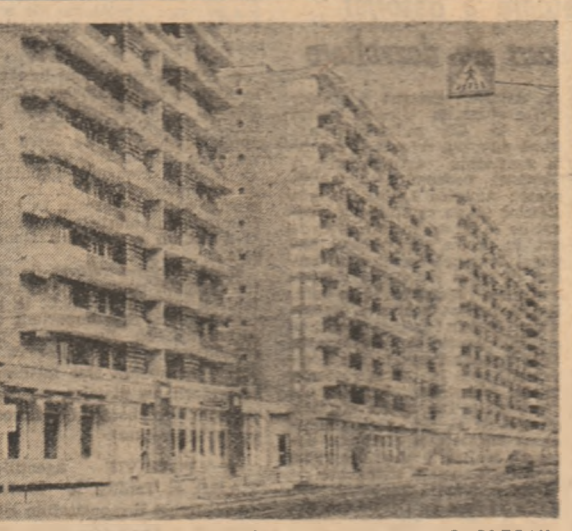
Din arhitectura nouă a Galațiului

Putem încredința în viața tineretului țării, Biroul de Turism pentru Tineret se prezintă în acest an cu un program de manifestări, acțiuni și activități turistice-educative și culturale.