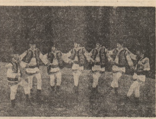
Are de horă din părțile Sucevei. Tinerete, vigoare, simfonie. A oamenilor și a braziilor, uniți prin verticalitate. Căruțele se purtă la fel și-n vremea lui Ștefan cel Mare...