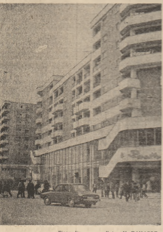
Tirgu Jiu

Vă prezentăm: ORGANIZAȚIA JUDEȚEANĂ TULCEA A U.T.C.