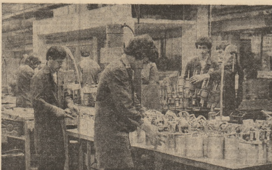
„Electroprecizia” Săcele, Brașov