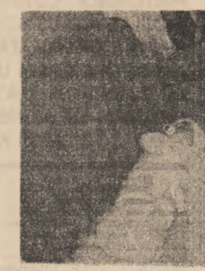
Dormi tu, că te veghes eu...