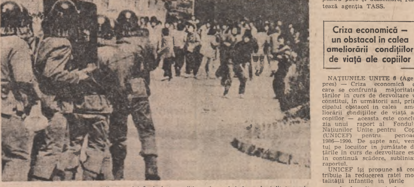
O imagine deja obișnuită pe străzile orașului Seul, forțe polițienești reprimind cu brutalitate o demonstrație studentescă antiguvernamentală