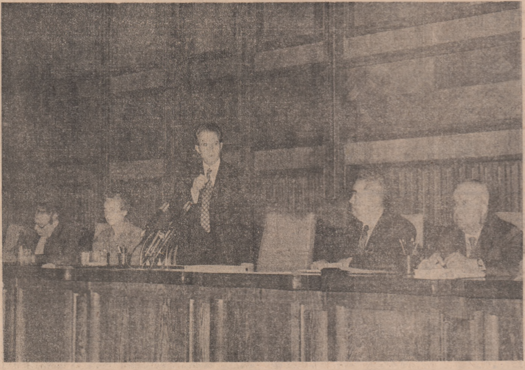
Sub președinția tovarășului Nicolae Ceaușescu, secretar general al Partidului Comunist Român, președintele Republicii Socialiste România, în zilele de 6 și 7 aprilie, la C.C. al P.C.R. au avut loc succese — pe domeniul de activitate și în plen — consfătuiri de lucru cu consiliile de coordonare din ramurile construcțiilor de mașini, metalurgiei, chimiei, petrochimiei și industriei ușoare, minelor, petrolului și geologiei, energiei electrice și termice, precum și cu Biroul Executiv al Consiliului Național al Agriculturii, Industriei Alimentare, Silviculturii și Gospodăririi Apelor și Consiliul de conducere al Ministerului Industrializării Lemosului și Materialelor de Construcții.