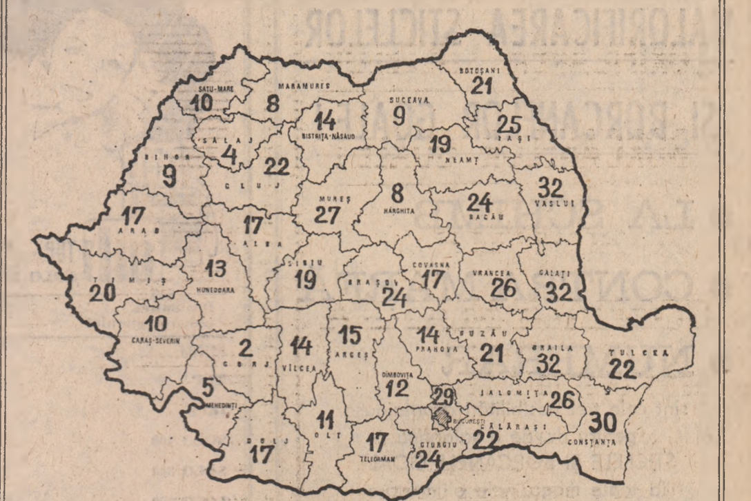
Stadiul însămînțărilor din campania agricolă de primăvară (în procente, în unitățile agricole socialiste) la data de 7 aprilie a.c.