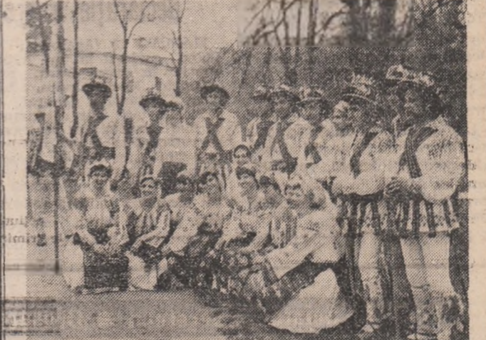
Perpetua tinerețe a portului popular