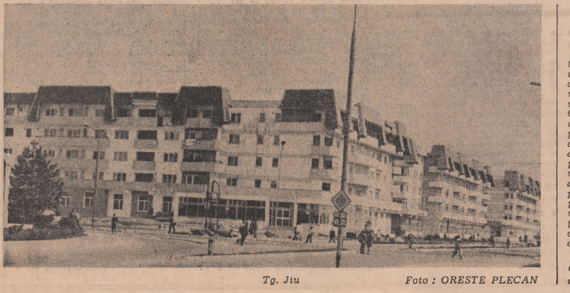
Tg. Jiu

perate presupune o concentrare deosebită din partea celor care o execută. Pericolul acut, este prezent. În munca noastră periculoasă poate fi redus, dar nu eliminat. Operația a decurs în continuare, pentru spectrul necrozat o execută. Pericolul acut, este prezent. În munca noastră periculoasă poate fi redus, dar nu eliminat. Operația a decurs în continuare, pentru spectrul necrozat o execută. Pericolul acut, este prezent. În munca noastră periculoasă poate fi redus, dar nu eliminat.