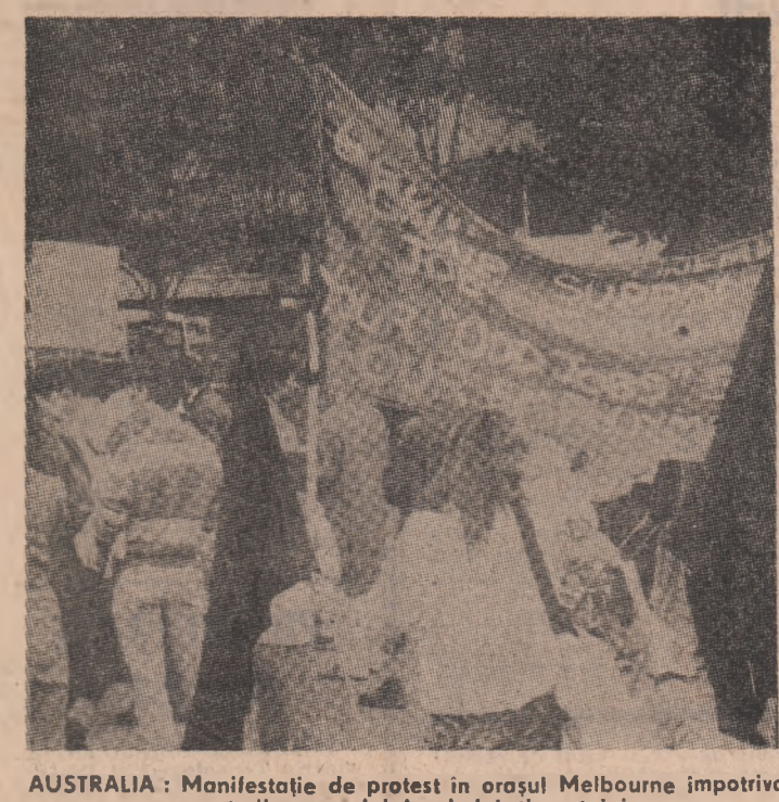
AUSTRALIA: Manifestație de protest în orașul Melbourne împotriva creșterii șomajului în rîndul tineretului