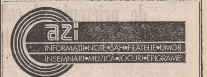
Pe cițiva quadrați