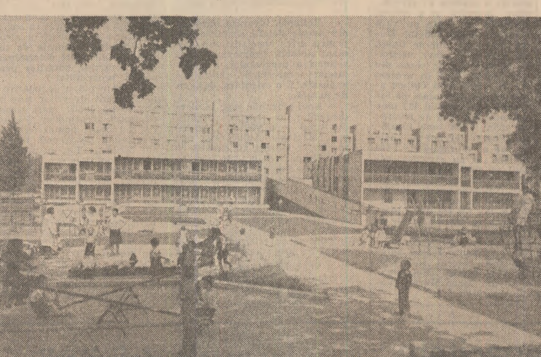
R. S. CEHOSLOVACĂ — Noi siluete arhitecturale într-unul din cartierele orașului Bratislava