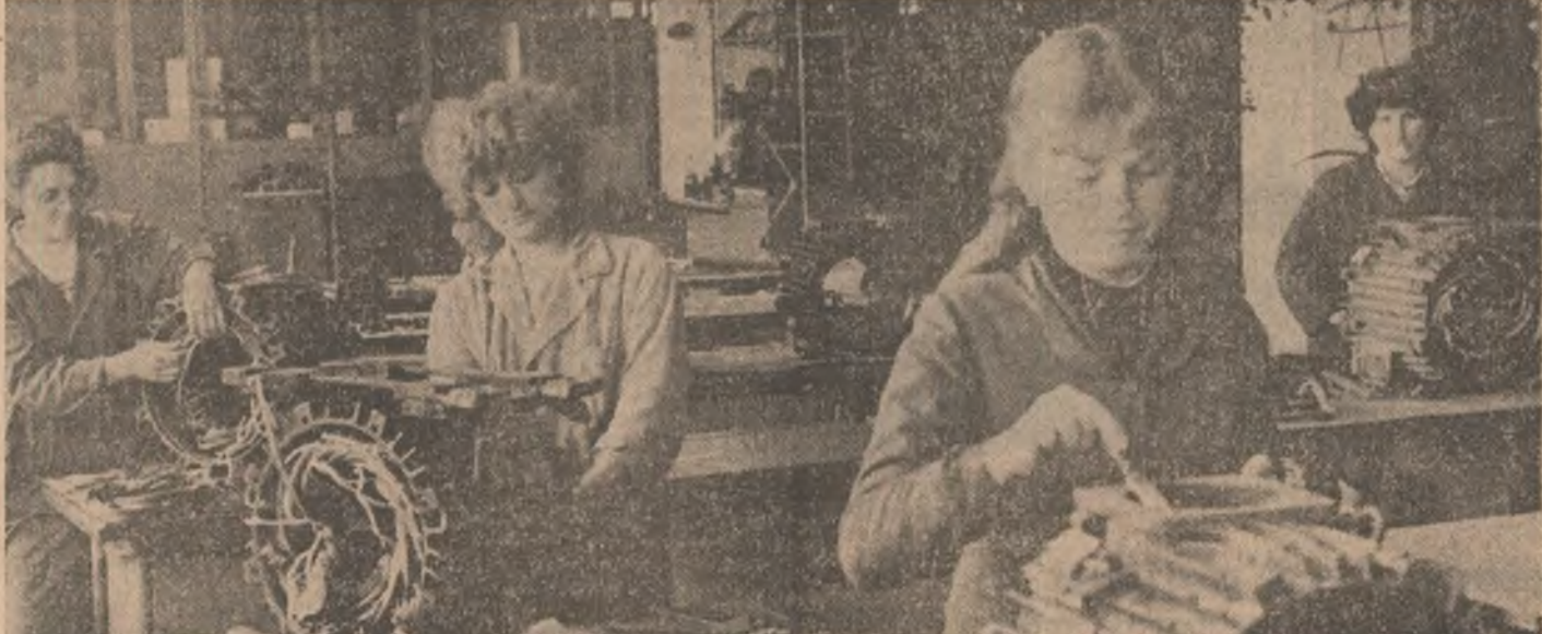
La Întreprinderea de Piese de Schimb și Reparații Utilaje, Echipamente Electrotehnice Minerale din Petroșani

■ Colectivele muncitorești din UNITĂȚILE INDUSTRIALE CLUJENE acționează cu forțe sporite pentru onorarea integrală a sarcinilor de plan pe acest an. Ca atare, în prima decadă a lunii octombrie au fost produse, peste prevederi, 180 tone caolin preparat, 3.000 tone ciment, 50.000 cărămizi și blocuri ceramice, însemnate cantități de cherestea de răscinoase și alte produse solicitate de economia națională. În prezent au fost mobilizate forțe importante pentru recuperarea restanțelor la o serie de produse cu pondere în economia județului — masini și utilaje, diverse sortimente de țesut, mobil etc. — astfel încît decalajele existente între unele din prevederile de plan la zi și nivelul realizării să fie eliminate în cel mai scurt timp, în condiții de eficiență economică ridicată.