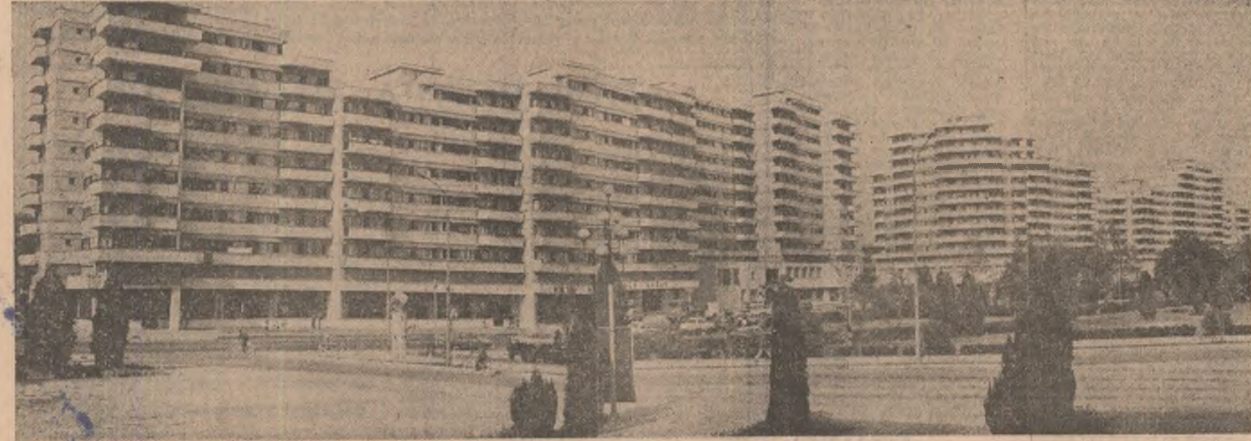
Un municipiu pe coordonatele viitorului 1 Alba Iulia

ȘERBAN NIOF (Continuare în pag. a III-a)