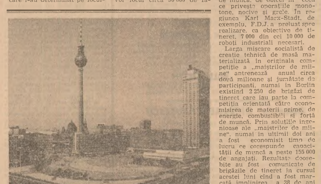
ÎNSEMNĂRI DIN R. D. GERMANĂ

Nici nu mai este nevoie să-i întreb pe berlinezi care este locul lor preferat din oraș, deoarece vorbesc de la sine fluxul impresionant de oameni care se perindă zilnic, mai mult sau mai puțin grăbiți, prin Alexanderplatz, în drăgăția intersecției din centrul Berlinului. Preferința concretizată și în faptul că „Alex” cum sînt spun familiarii localnici a devenit simbolul profilului contemporan al metropolei de pe rîul Spree, mereu mai tînăr, și în poziția celor 750 de ani de existență atestată documentar chiar astăzi, 28 octombrie. Motivele care l-au determinat pe locu-