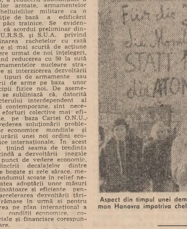
Aspect din timpul unei demonstrații a tinerilor din orașul vest-german Hanover împotriva cheltuielilor militare și a cursei înarmărilor nucleare

Actuala semnare a acordului sovieto-american este un pas istoric în procesul de înșănătoșirea situației internaționale, transmite agenția T.A.S.S.