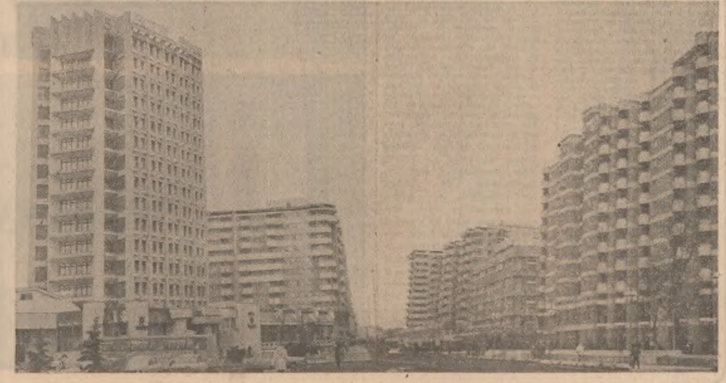
Definiție urbanistică modernă a Bacăului

ȘT. DORGOȘAN (Continuare în pag. a IV-a)