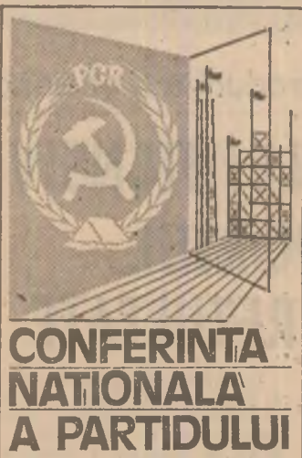
CONFERINȚA NAȚIONALĂ A PARTIDULUI