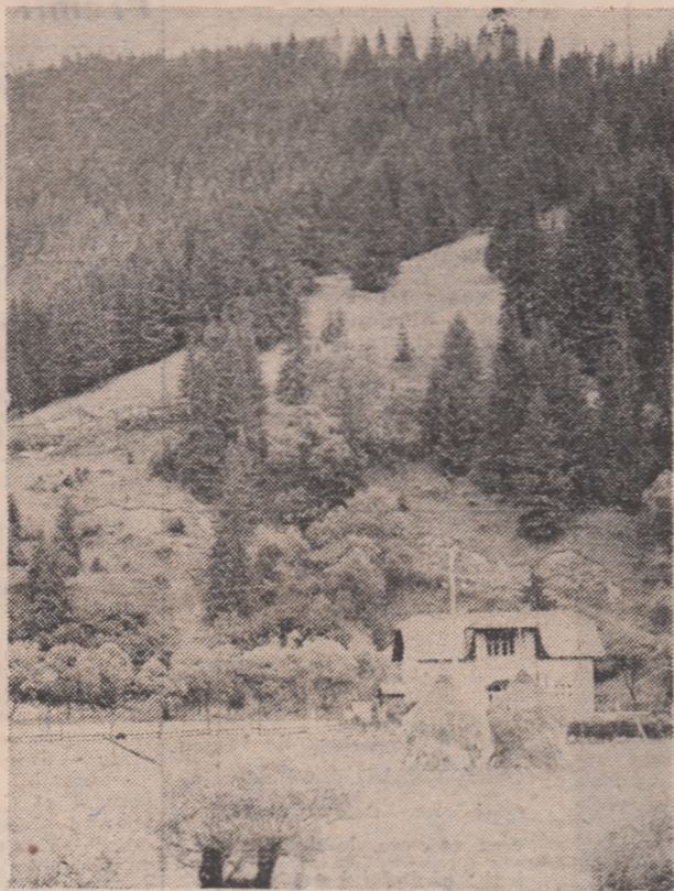
Eterna frumusețe a pământului românesc

Am putut de atâtea ori afirma că în prezentul românesc, cultura, creația oamenilor de litere, științe și arte, participă intens, în interferență luminoasă cu celelalte sfere de activitate umană, la opera de construire a societății noi românești, parte integrantă, inseparabilă, a acestei mari opere colective, aducându-și prin aceasta și importanța ei contribuție originală la patrimoniul culturii și artei universale.