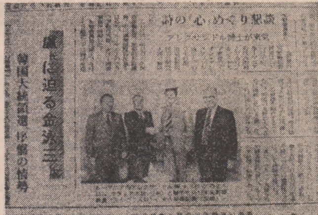
Presa japoneză — iată o imagine clocontă — a consemnat pe potrivă evenimentul