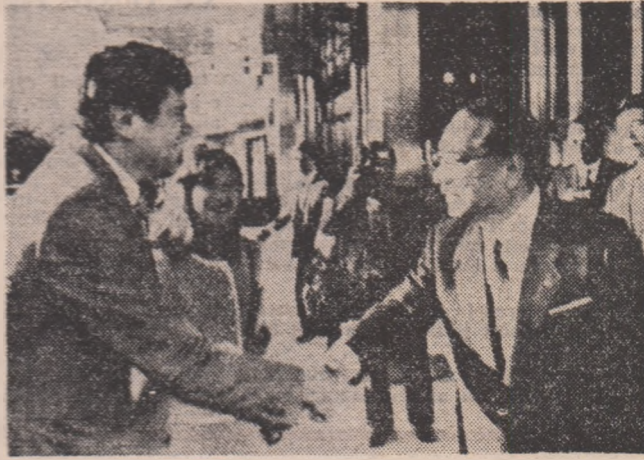
O festivitate din care n-au lipsit blitzurile fotografiilor

Premiul internațional cu medalia de aur a fost atribuit, deci, poetului român Ioan Alexandru. De fapt, într-o ordine superioară a semnificațiilor, acest premiu încununează, pe plan internațional, valoarea și deschiderea umanistă a poeziei noastre actuale, a literaturii românești contemporane, a întregii culturi pe care o făurim aici și acum.