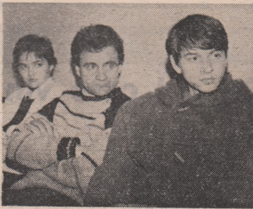
Arta de a asculta