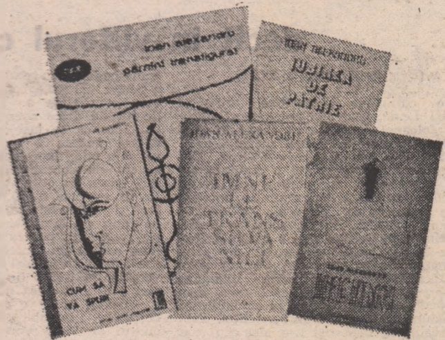
Ioan Alexandru nu a scris numai cărți. El a creat o operă poetică