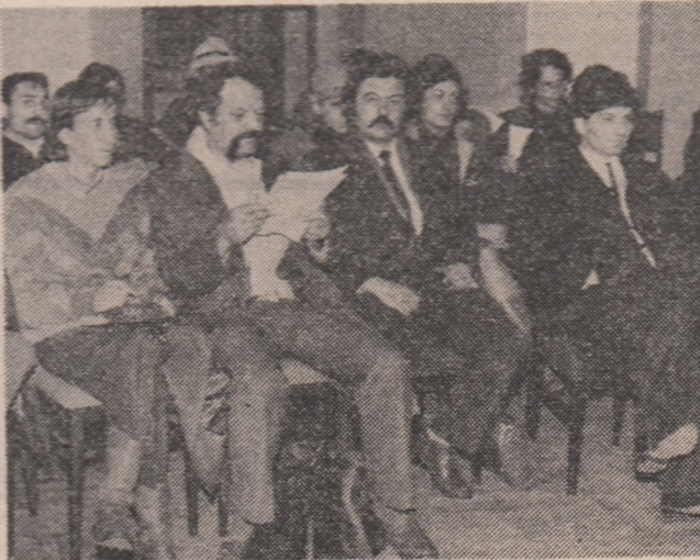
Poeți, critici, prozatori...