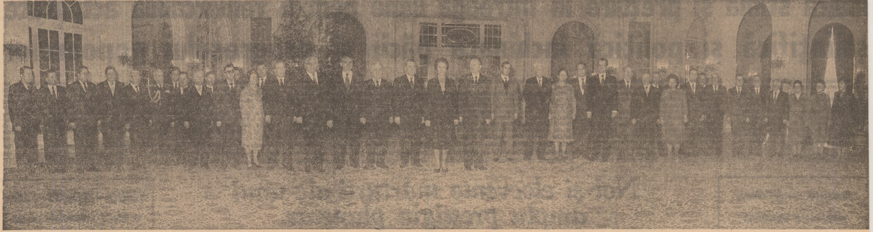
(Urmare din pag. 1)

denței și suveranității sale. În război și în pace, în toate împrejurările, ea a fost tot mai înaltă de progres și civilizație. Solemnitatea a dat expresie sentimentelor de profundă prețuire și aleasă stimă pe care comunitățile întregii noastre țări le poartă tovarășei Elena Ceaușescu, militantă de frunte al partidului și statului, eminentă deosebită de știință și de largă recunoaștere internațională, pentru contribuția sa deosebită la elaborarea și înfăptuirea politicii interne și externe a partidului și statului, a luminosului program de edificare a societății socialiste multilaterale des-