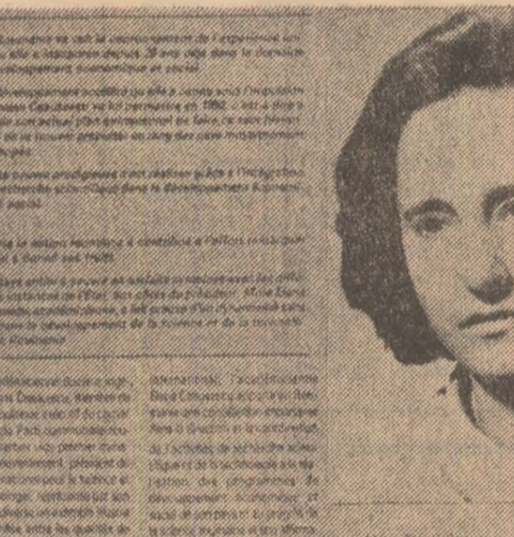
Academiciena doctor inginer Elena Ceaușescu

Printre lucrările teoretice, prin lucrările practice în domeniul chimiei macromoleculare, Elena Ceaușescu își înscrie numele în rândul marilor savanți români ai tuturor timpurilor. Operele științifice, avînd înscris pe frontispiciul lor numele său au fost traduse în toate limbile de circulație mondială, avînd astăzi o înaltă valoare în ramu-