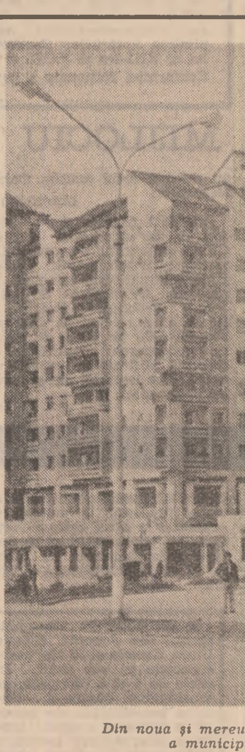
Din nou și mereu mai tînăra arhitectură a municipiului Petroșani