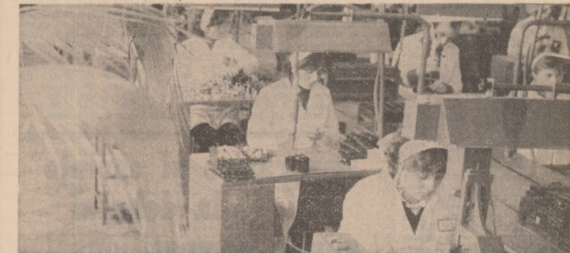
Întreprinderea de contactare din Buza