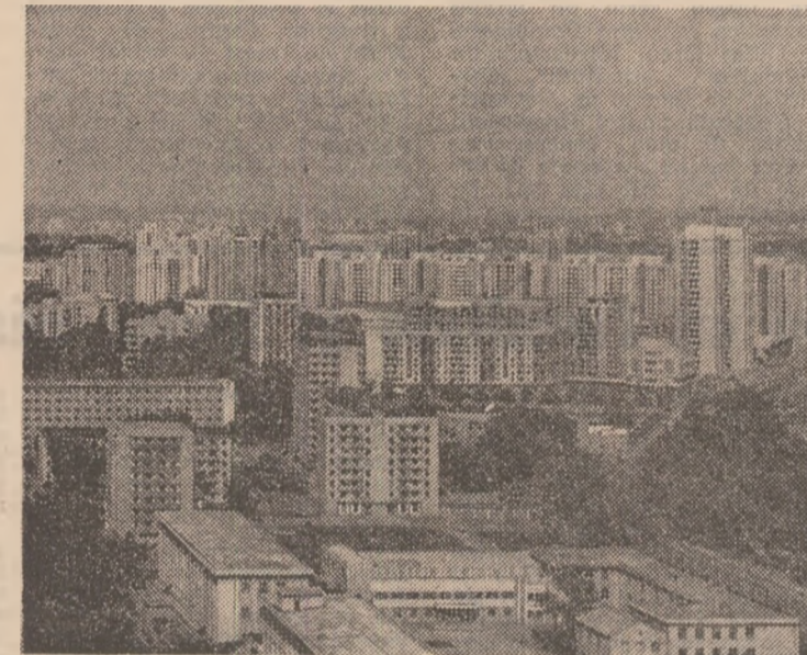
R.P.D. COREEANA: Arhitectură nouă, modernă în capitala țării, orașul Phenian

CAIRO 7 (Agerpres). — Egiptul și Republica Togoleză condamnă repressiunile forțelor israeliene de ocupație împotriva populației palestinienne de pe Malul vestic al Iordanului și din Gaza, se arată în declarația comună dată publicității la Cairo la încheierea primei sesiuni a Comitetului superior egiptoano-togolez. Cele două țări au reafirmat adepțiunea la principiile și obiectivele Organizației Unității Africane și au condamnat politica de apartheid a regimului minoritar rasist de la Pretoria, informează agenția China Nouă.