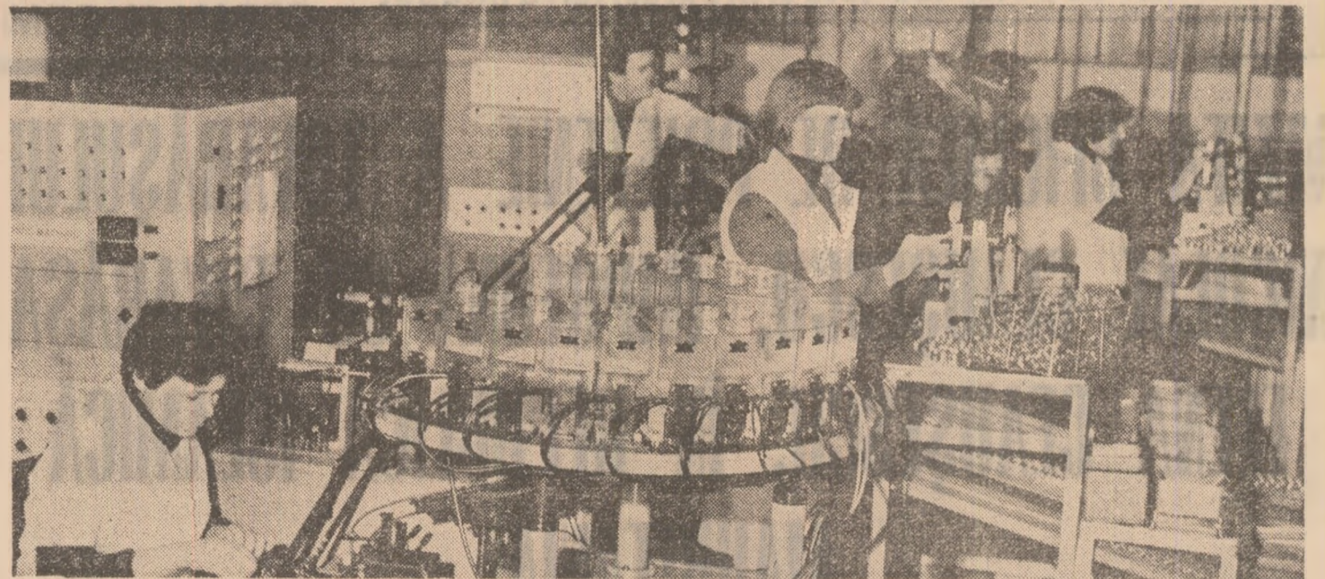
Prin reparații capitale de calitate, prin exploatare judicioasă