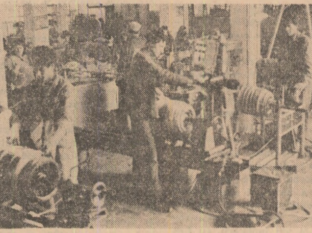
AMPLU PROGRAM DE AUTOULIARE