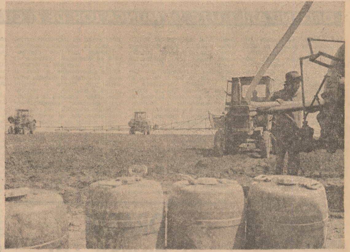
Prețuirea temeinică a terenurilor și desfășurarea de calitate a însămânțărilor, iată condiții care asigură, din aceste zile, o bază trainică recoltelor mari din acest an.