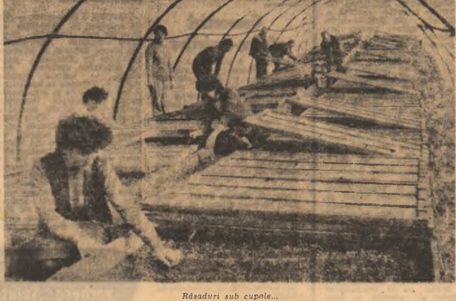
Răsaduri sub cupole...