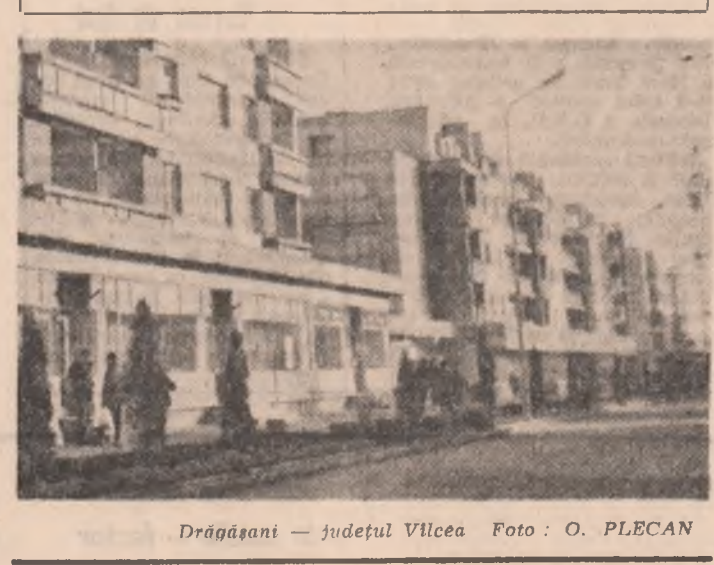
Drăgășani — județul Vâlcea