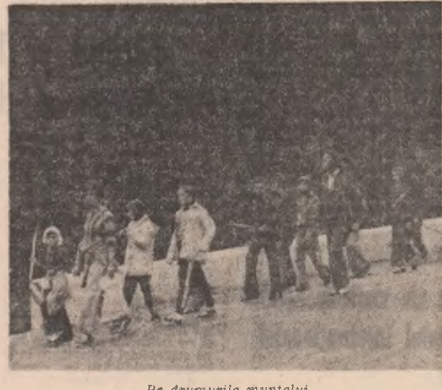
Pe drumurile muntelui