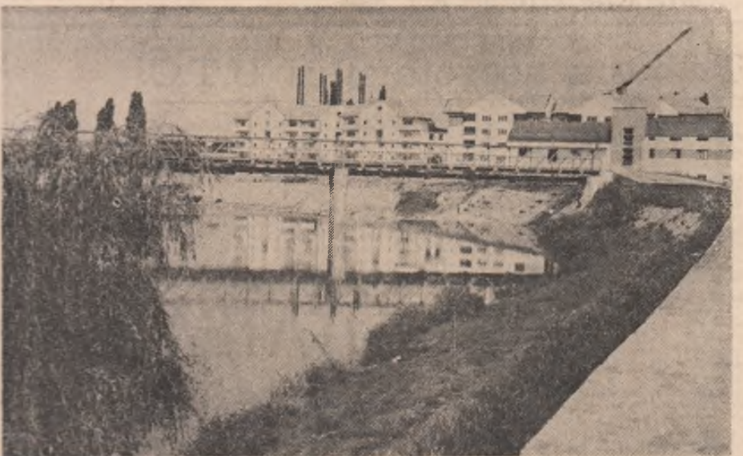
La Lugoj — construcții moderne pe malul Timișului

Opera teoretică și practică a tovarășului Nicolae Ceaușescu — mobilizator program de acțiune revoluționară pentru întregul nostru popor, pentru toți tinerii patriei