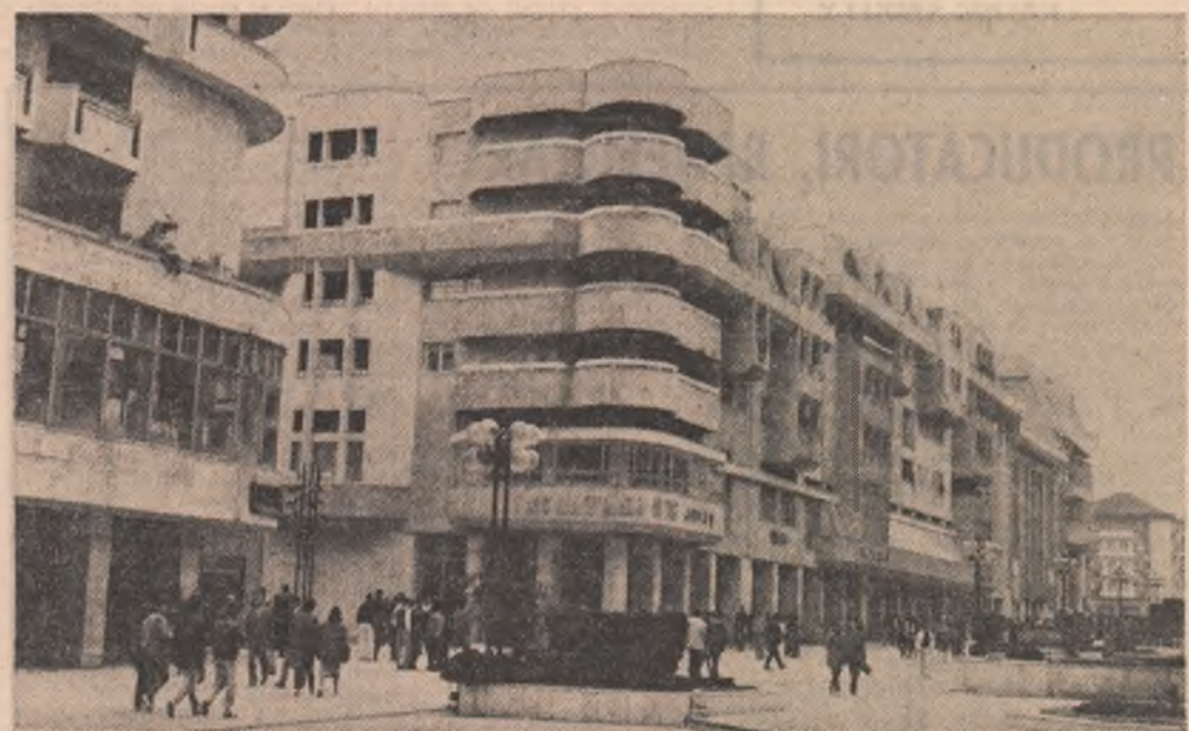
Imagine din Craiova