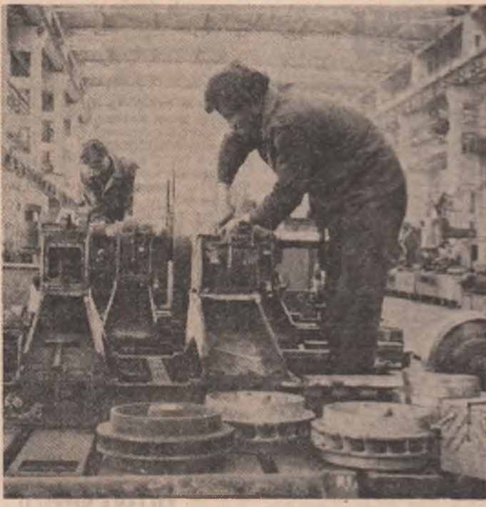
I.C.M. Caransebeș — o nouă microturbină este pregătită pentru a fi livrată beneficiarilor.