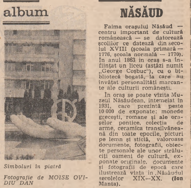
Simboluri în piatră