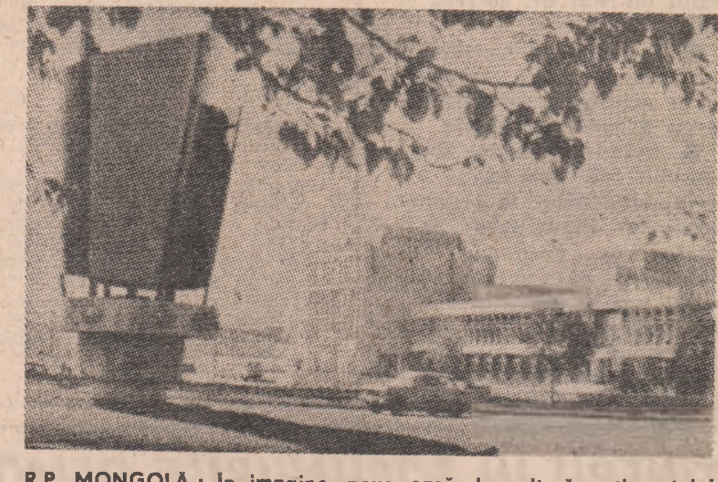
R.P. MONGOLIA: În imagine, noua casă de cultură a tineretului din capitala țării Ulan Bator

LIMA 4 (Agerpres). — Luind cuvîntul în cadrul ședinței Fondului pentru contracararea intervenției, colonialismului și apartheidului (Fondul pentru