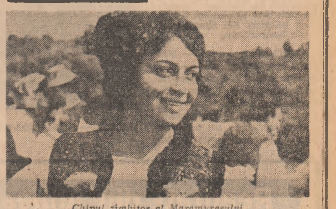
Chipul zimbitor al Maramureșului.