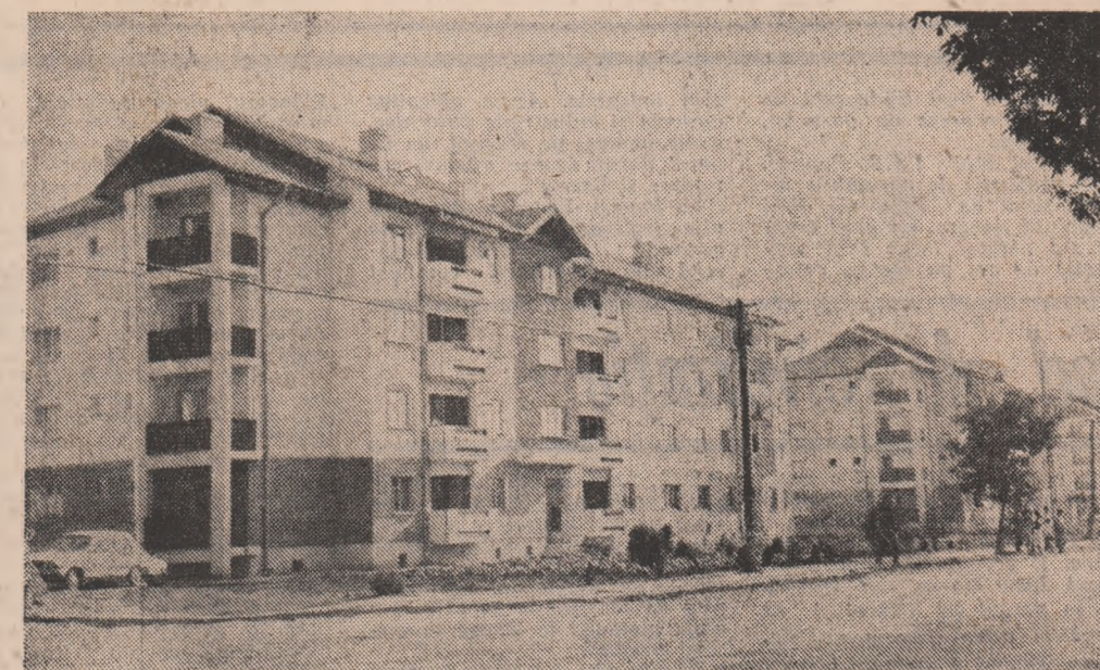
Construcții noi, moderne în Popești Leordeni