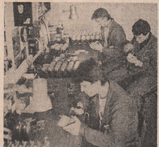
ACȚIUNI SUSȚINUTE PENTRU INDEPLINIREA EXEMPLARĂ A SARCINILOR DE PLAN

In porturile dunărene Tulcea, Sulina, Mahmudia, Isaceea și Macin, se desfășoară o activitate susținută pentru îndeplinirea exemplară a principalelor indicatori de plan și scurtarea timpului de staționare a navelor fluviale și maritime sub operațiuni de încărcare-descărcare.