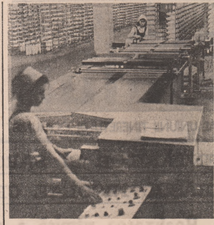
Intr-o secție modernă a întreprinderii de fir și fibre poliamidice din Roman

capacități de producție date în folosință