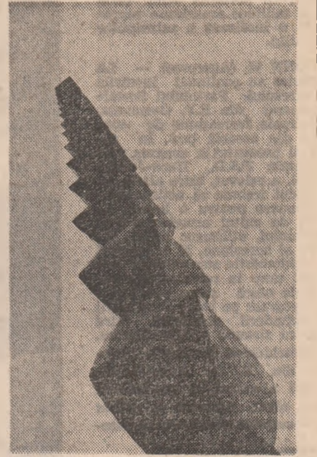
Zbor spre înfinit