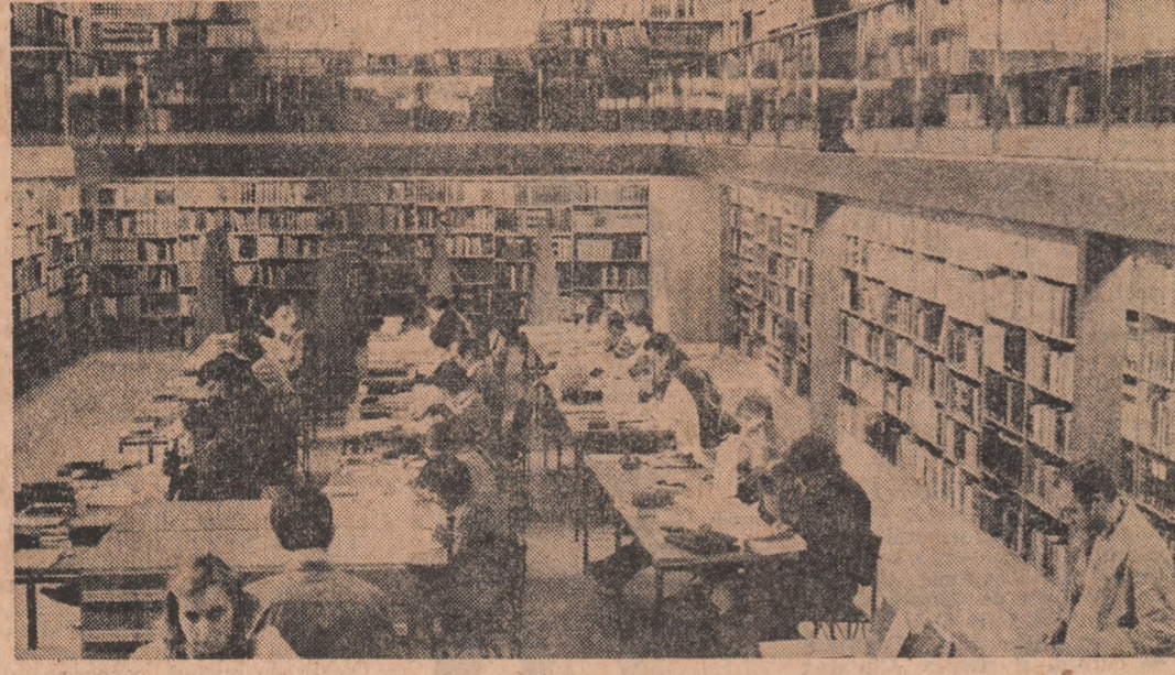
R.D.G. : Imagine din una din sălile de lectură ale Bibliotecii de Stat din Berlin

În campania precedentă, lansată în cadrul pregătirilor pentru recenta aniversare a împlinirii a 40 de ani de la crearea R.P.D. Coreene, toate angajamentele asumate au fost îndeplinite. Astfel, după cum informează agenția ACTC, producția industrială a crescut cu 22 la sută comparativ cu perioada similară a anului trecut. În domeniul construcțiilor capitale, principalul front al întrecerii, s-au obținut cele mai bune rezultate de la crearea republicii. În agricultură, în acest an a fost obținută o recoltă record.