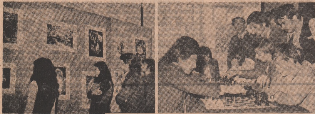
Astăzi se deschide

Comitetul orășenesc Baia de Aramă al U.T.C. vă invită la parada portului „Cintecului și jocului popular, ce va avea loc