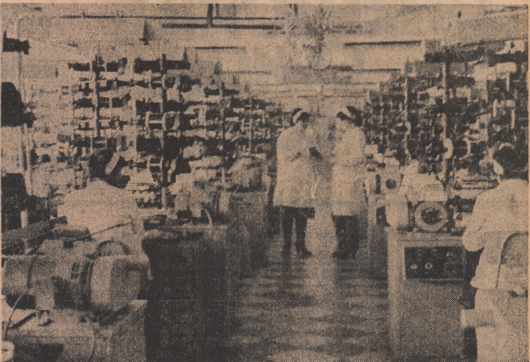
Întreprinderea de Contactoare din municipiul Buzău

bilizatoare programe de muncă și acțiune, pentru continuarea modernizării învățămîntului de toate gradele, în concordanță cu hotărârile Congresului al XIII-lea și Conferinței Naționale ale P.C.R., cu rolul tot mai important pe care-l au știința, învățămîntul și cultura ca factori hotărâtori în făurirea socialismului și comunismului. În acest sens, este evidențiată hotărârea fermă de a acționa pentru ca învățămîntul de toate gradele să se ridice la nivelul condițiilor create de societatea noastră socialistă pentru întregul tineret, în vederea pregătirii temeinice pentru muncă și viață a tinerei generații, pe baza celor mai noi cuceriri ale științei și tehnicii, ale cunoașterii umane în general.