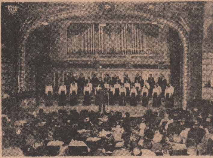
sub genericul „Cint și joc pe plai străbun”.

La Clubul Intreprinderii mecanice de material rulant din Craiova are loc vernisajul expoziției de carte social-politică. (C.B.).