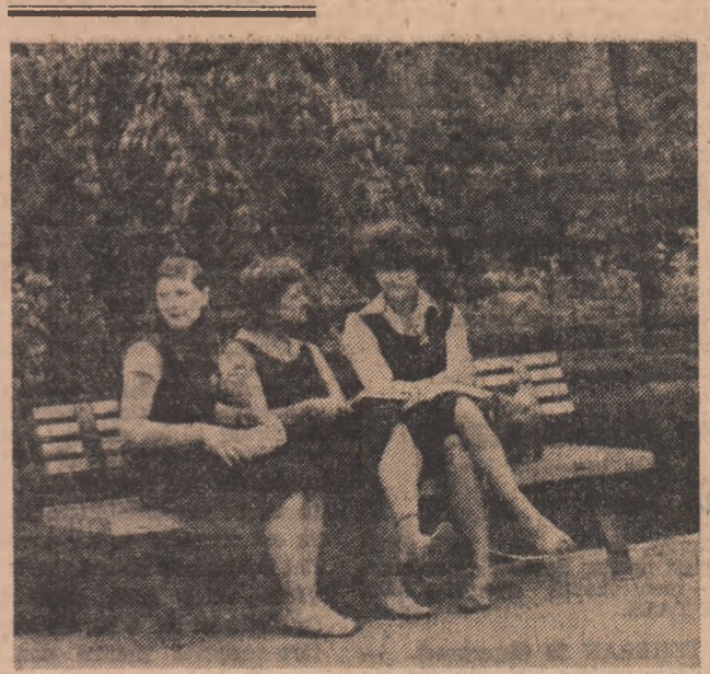
„Liceenele” înaintea primului „extemporal la dirigenție”...!