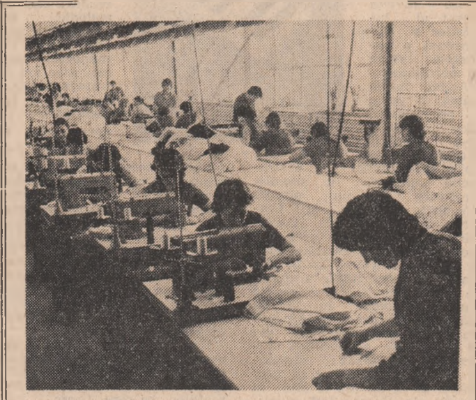
Economii în valoare de 7,5 milioane lei

Concomitent cu eforturile depuse pentru îndeplinirea sarcinilor de plan, oamenii muncii de la Întreprinderea „Electromotor” din Timisoara acordă o atenție deosebită valorificării eficiente a materiilor prime, materialelor și combustibilului. Astfel au fost aplicate o serie de inițiative muncitorești care s-au materializat în obținerea unor economii de 7,5 milioane lei.