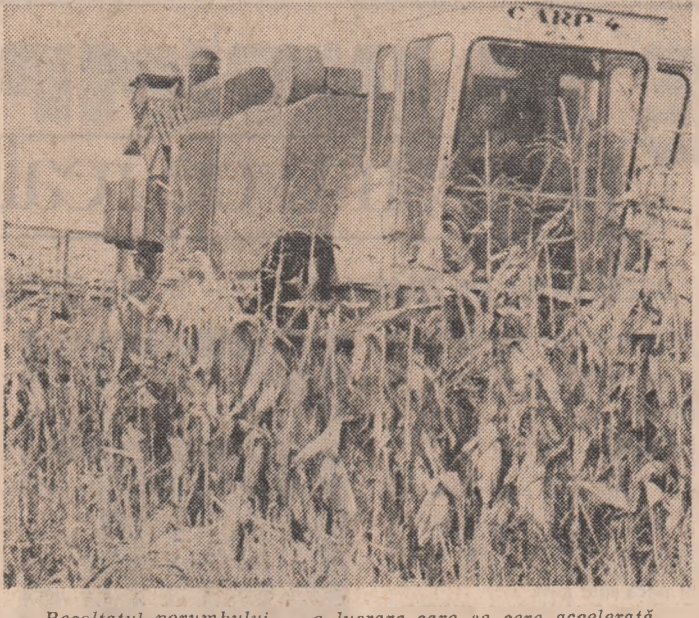
Recoltatul porumbului — o lucrare care se cere accelerată în vederea eliberării terenurilor și pregătirea acestora pentru însămînțări