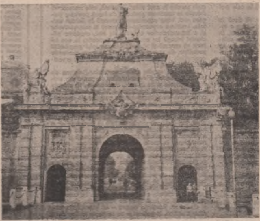
Și la Alba Iulia, în ziua de 16 noiembrie 1918, deosebită sărbătoare a unirii, au avut loc într-o sală din oraș, în fața clădirii actuale a Ministerului de Interne, o serie de discuții și negocieri.

În primele ore ale dimineții de 1 Decembrie înreaga atmosferă a orașului suna multumimile că ziua cea mare a sosit. Poporul (peste 100.000 de persoane) s-a înclinat spre catedrală în jurul orașului, din partea de vest a țării, nu departe de locul supliciuului lui Horea și Cloșca. Delegații s-au întrunit la ora 10 în sala cea mare a cazinoului ofițerilor din cetatea Alba Iulia, care din atunci s-a numit „Sala Unirii”.