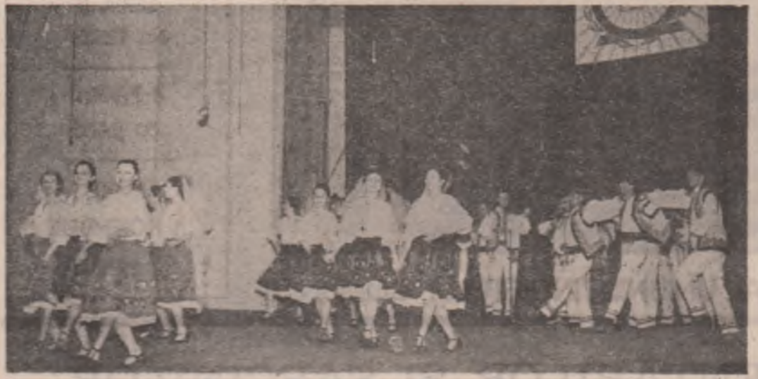
Festivalul național „Cîntarea României”