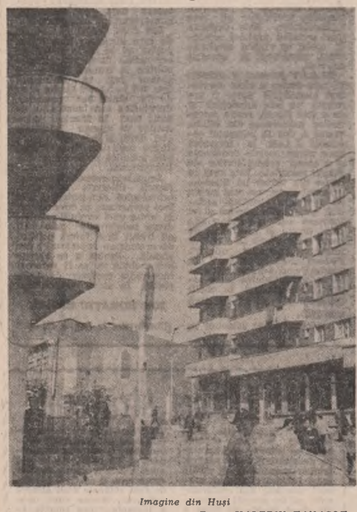
Imagine din Husi