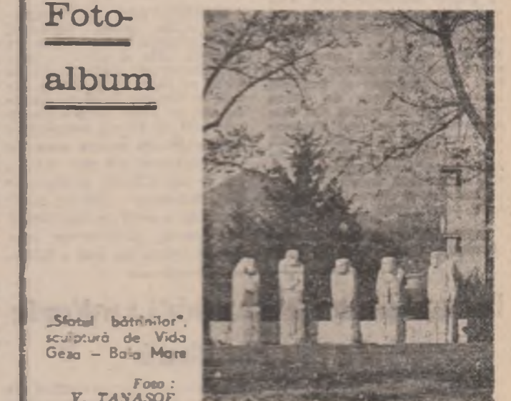
„Școlă bătăniilor“, sculptură de Vido Geac — Baia Mare