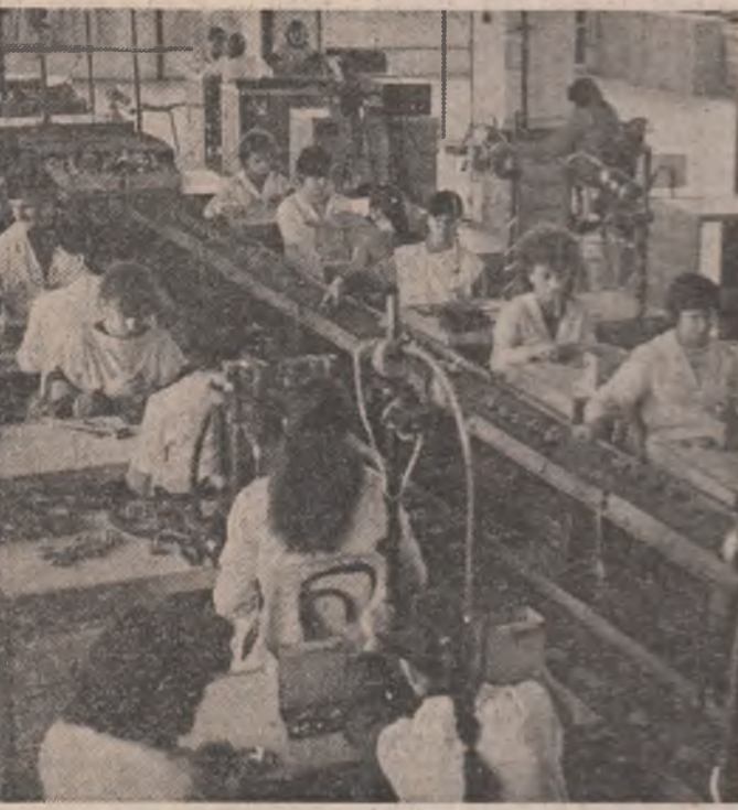
Intreprinderea de Ceasornice „Victoria” din Arad