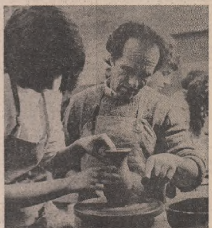
Olăritul este, la Troian, o ocupație cu vechi și frumoase tradiții. Tainele meșteșugului sunt transmise cu grijă din generație în generație...