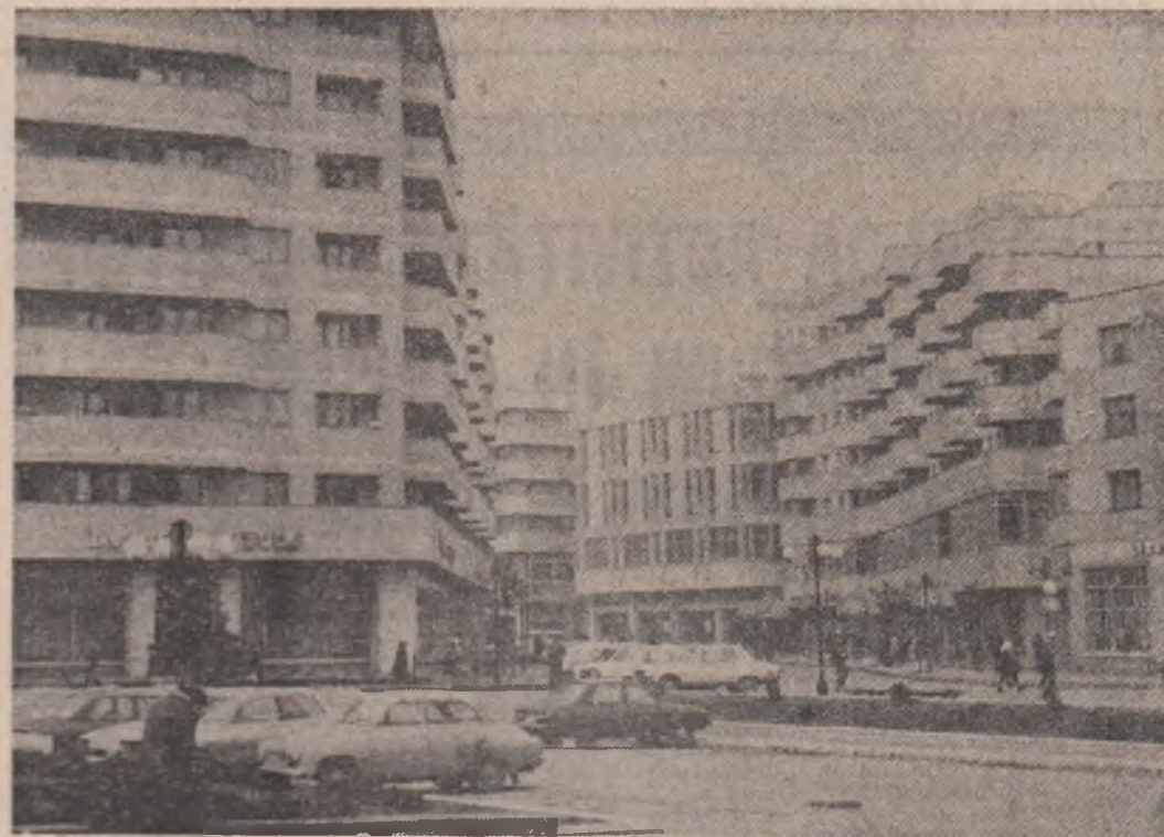
Imagine din municipiul Ploiești