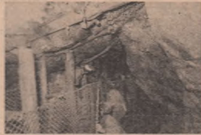
La Căruș, în abiați

de fapt că, în paralel, s-au executat și sculele necesare, precum și standul de probe, câștigându-se astfel timpul care s-ar fi consumat cu pregătirea de producție. De puțin timp, întreprinderea efectuează, la utilajele livrate de ea, reparații capitale, care nu se pot face în unitățile beneficiare. Se reconstruiesc arborii cotiți