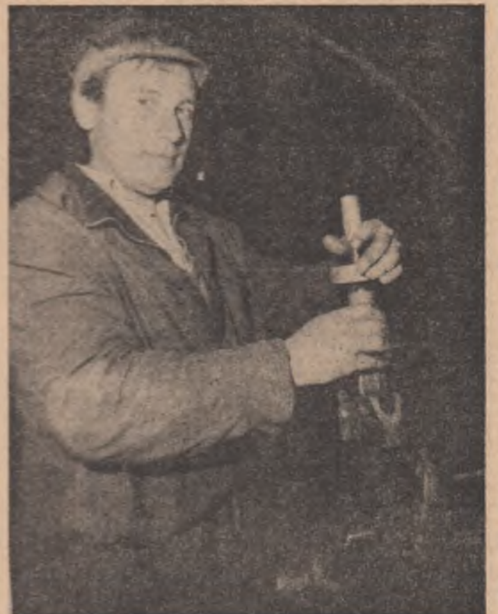
Perforatoarele pentru maramureșeni care lucrează în subteran sînt puse la punct de către maramureșeni care lucrează la suprafață...