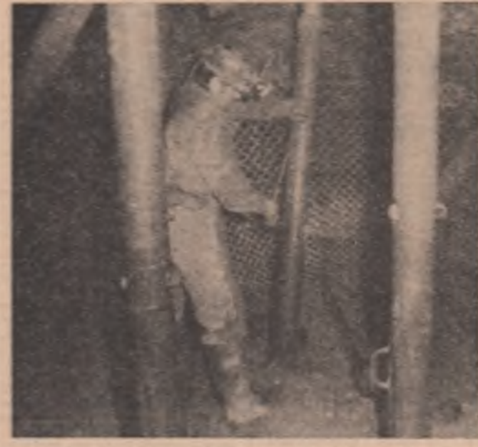
Într-un abiați sînt oameni de rezolvat probleme asemănătoare cu cele ridicate de construirea unei case...