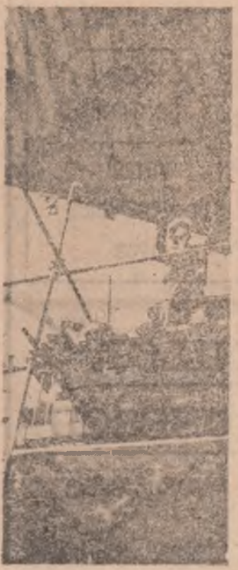
Santierul Naval Brăila