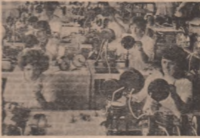
Întreprinderea de Aparat de Măsură şi Control din Vaslui