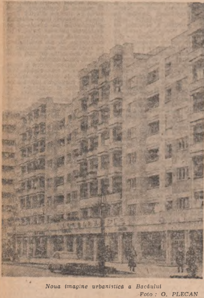
Noua imagine urbanistică a Bacăului