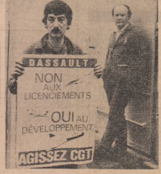
„NU concedierilor I DA dezvoltării I” — aceasta este opțiunea oamenilor muncii de la firma franceză „Dassault” care protestează împotriva creșterii somajului