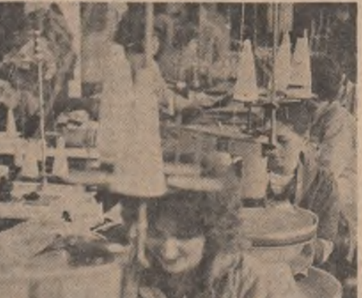
Fabrica de confecții din Toplița. Întreprinderea este mai tânără decât oamenii ei!