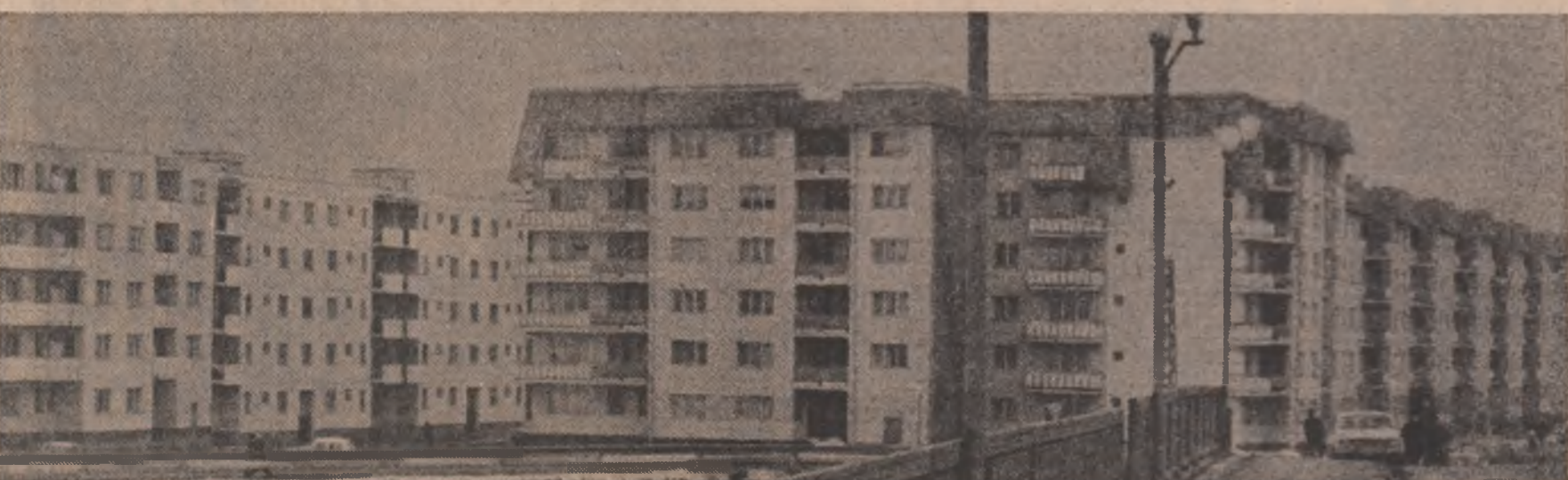
Not locuințe în municipiul Sfintu Gheorghe

G. COCHINESCU (Continuare în pag. a V-a)