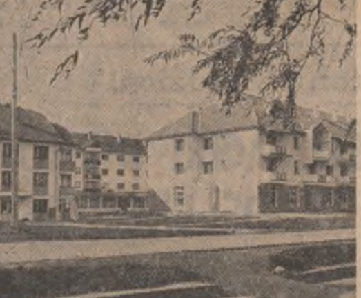
Sărmașul — o comună care își merită sărbătorile