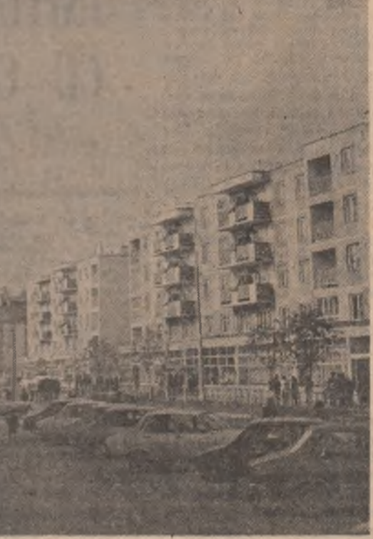
Toplița, un oraș care se deschide spre contemporaneitate