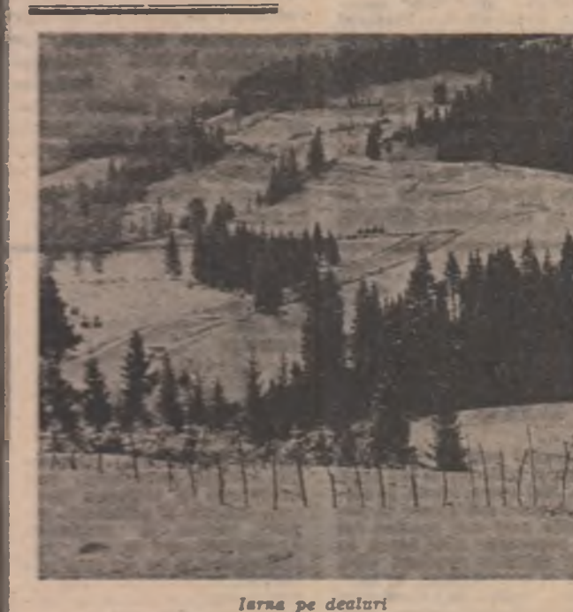
Între pe dealuri