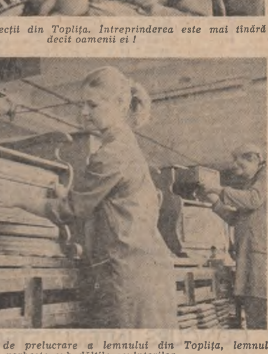
La Combinatul de prelucrare a lemnului din Toplița, lemnul vorbește sub dățile sculptorilor