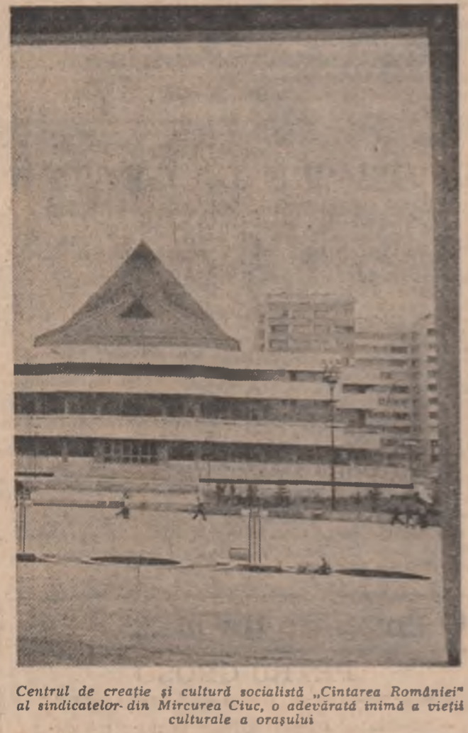
Centrul de creație și cultură socialistă „Cintarea României” al sindicatelor din Miercurea Ciuc, o adevărată inimă a vieții culturale a orașului