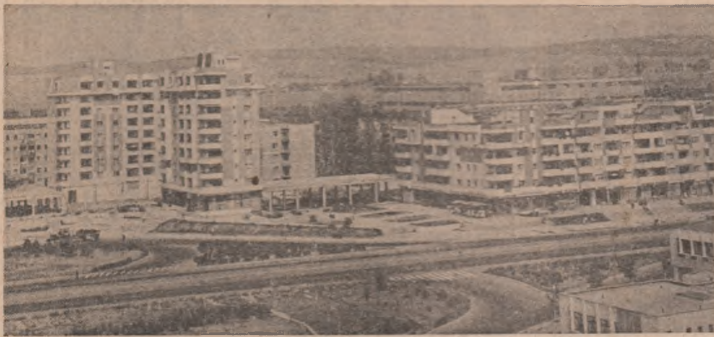
Profil urbanistic craiovean

IN PAG. A 3-A : Din experiența unităților agricole frunțate.