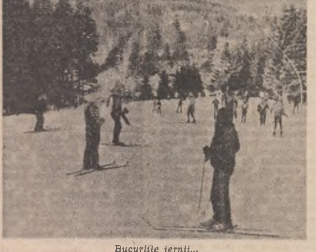
Bucuriile serii...