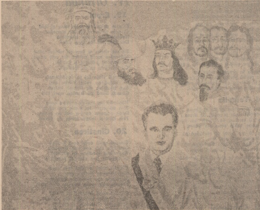
Pictură de EUGEN POPA

Tinărul revoluționar comunist Nicolae Ceaușescu — efigie de erou între eroii neamului românesc.