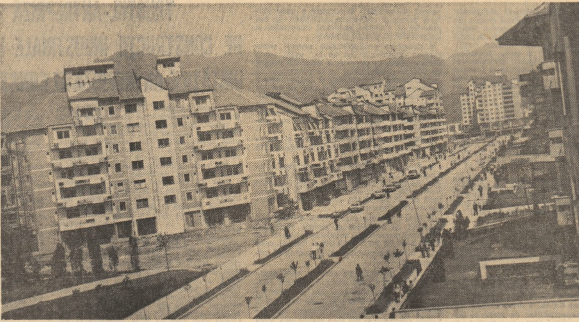
Noile cote urbanistice ale Petroșaniului

(Continuare în pag. a V-a) GHEORGHE DARAGIU