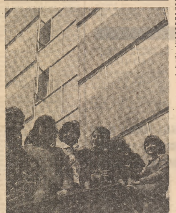
INSEMNAȚII DIN U.R.S.S.

Alături de gîndurile acestor tineri, confesiunile lor sincere, directe, imaginile lor frumoase, aite de diferite, dar deopotrivă de tonice, lumea lor proprie apare, fără îndoielă, ca o lume a dorințelor de acțiune, a deschiderii către viitor. Pentru că universul lor de creație de afirmare este chiar universul în care trăiesc — școala, biblioteca, laboratorul, uzina sau scena — dar, nu mai puțin, și cel al unor legături complexe, pe care ei, tinerii, le doresc mai profunde și mai trainice. Ex-