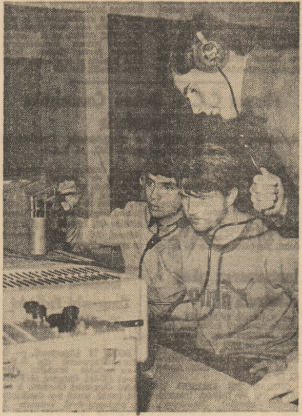
Cercul de radioamatorism de la Centrul de creație și cultură socialistă pentru tineret din Cimpina

Președintele Fondator al Adunării Poporului Togolez, Președintele Republicii Togoleze