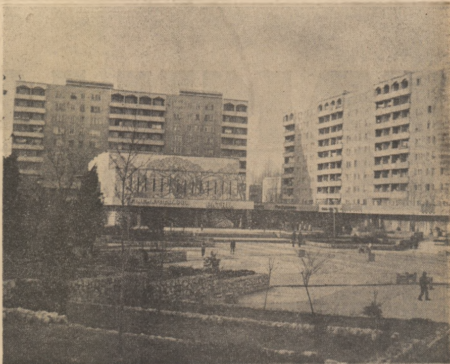
Piața Magnoliei din municipiul Oradea.

Opera social-politică și filosofică a tovarășului Nicolae Ceaușescu, strălucită contribuție la dezvoltarea teoriei și practicii revoluționare, magistrală călăuză în acțiune pentru partid, pentru tinăra generație, pentru întregul nostru popor