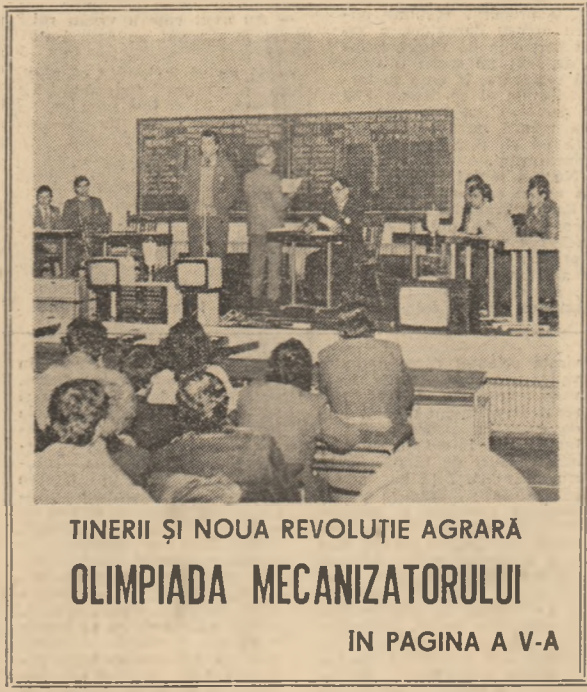
TINERII ȘI NOUA REVOLUȚIE AGRARĂ OLIMPIADA MECANIZATORULUI IN PAGINA A V-A

atît materialele prezentate, cît și discuțiile au avut un ton critic și autentic, dînd un caracter de lucru acestui forum al democrației cooperatiste. Beneficiul unității, se arată în darea de seamă este diminuat cu peste 1 milion lei, datorită pierderilor înregistrate în zootehnie. Această influență negativă asupra eficienței muncii o au cheltuielile mari, peste prevederi, la cultura porumbului, soiul în funcție de precum și a încălzirii cheltuielilor legate de procurarea semintelor. Fără îndoială, au fost evidențiate și rezultatele bune, cooperatorii care au contribuit la realizarea lor. Munca acestora a fost răsplătită. CALIN FOXT MIKCEA BORDA (Continuare în pag. a V-a)