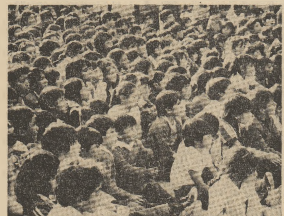
În ochii tuturor acestor copii viitorul se conturează ca un univers al bucuriei și speranței de care nimeni nu are dreptul să-i frustreze

R.P.D. Coreeană dispune de o industrie armonios dezvoltată, dotată cu tehnici moderne. Apărarea este valabilă și în domeniul distructurilor metalurgice, chimiei și a materialelor de construcție. Topiciile și oțelăria au fost modernizate sau extinse pe baza tehnologiei de vîrf, au fost înlocuite în producție noi procedee de prelucrare a metalelor, s-a lărgit gama de oteluri, s-a ameliorat calitatea lor și s-au multilateralizat tipul și calitatea produselor laminate. Grupaj realizat de A. MUNTEANU