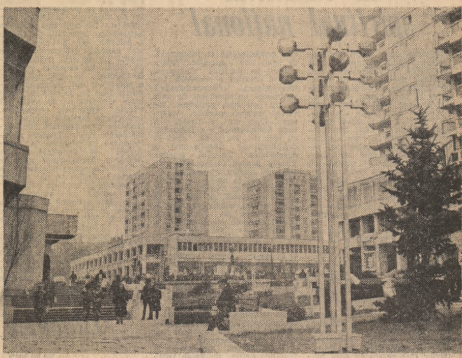
Municipiul Pitești