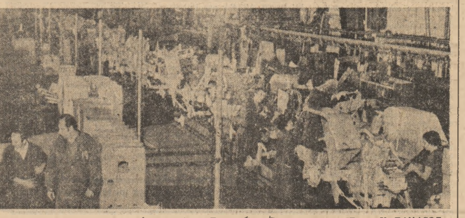
Întreprinderea Tractorăi — Brașov

judicioasă a utilajelor din dotare, a materiei prime și materialelor, a gîndirii tehnice și științifice a tinerilor. Ca o cunună a eforturilor îndepărtate de mai sus, evidențiez că în anul trecut întreprinderea noastră a