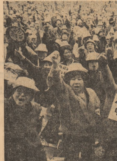
JAPONIA: Demonstrație de protest desfășurată în Parcul Hiyo din Tokio împotriva noului sistem de taxe ce afectează negativ nivelul de trai