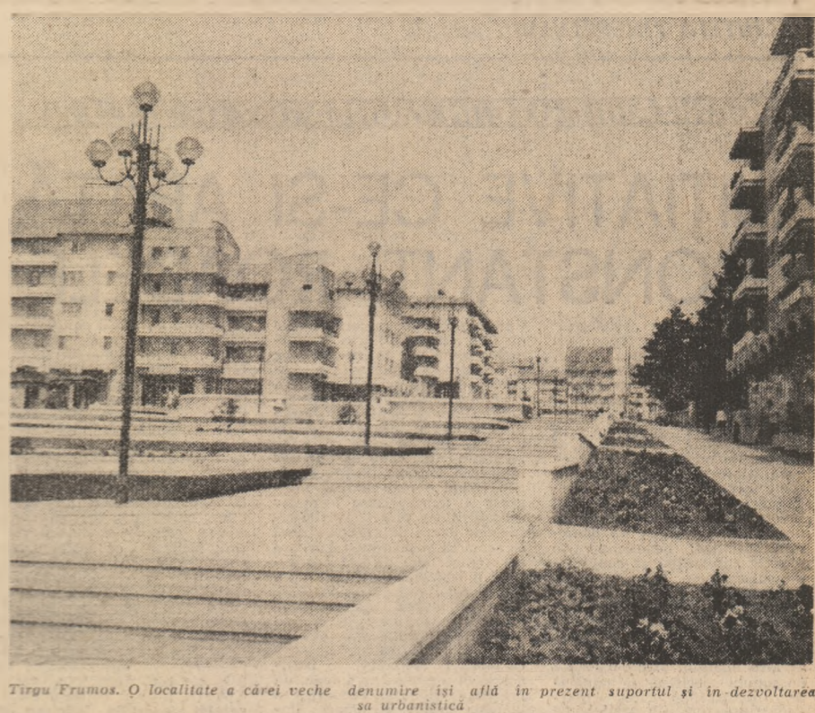
Tirgu Frumos. O localitate a cărei vechi denumire își află în prezent suportul și dezvoltarea sa urbanistică.